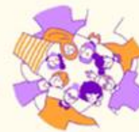
Unge fortsætter som frivillige og er en del af et frivilligt fællesskab