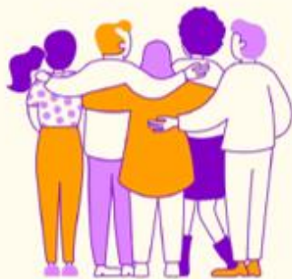
Frivillige i grupper