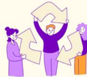
Med støtte fra underviser