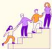
Unge klædes på til frivillighed