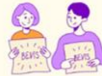
Unge fejres og får frivilligbeviser