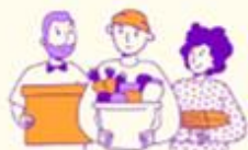
Unge møder forening