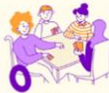
Unge er frivillige i grupper i skoletiden med støtte